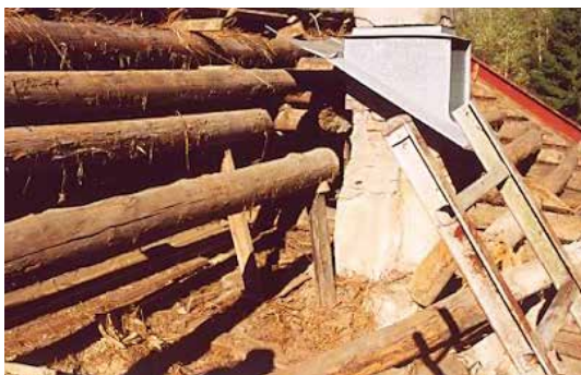
Ett par stockar i närheten av murstocken var i så dåligt skick och till och med avruttnade att de fick bytas före man reglade upp taket igen.