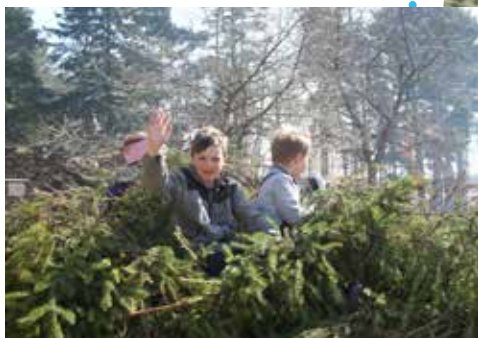
Risåkning på Tegelbruksängen våren 2011