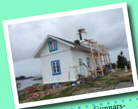
Renoveringen av Gunnarsholmens fyr fortskrider.