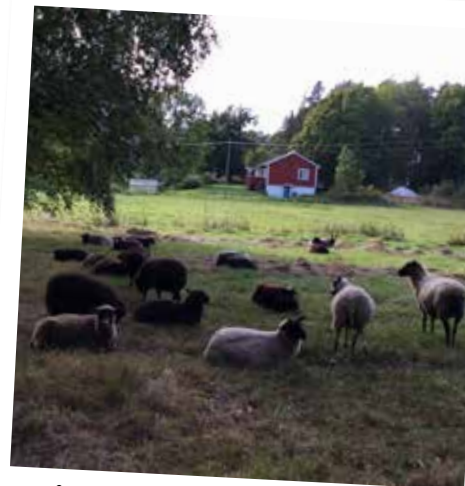
Fåren betar på Stenstakaängen