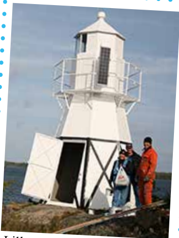
Lilla Brattens fyr hösten 2014