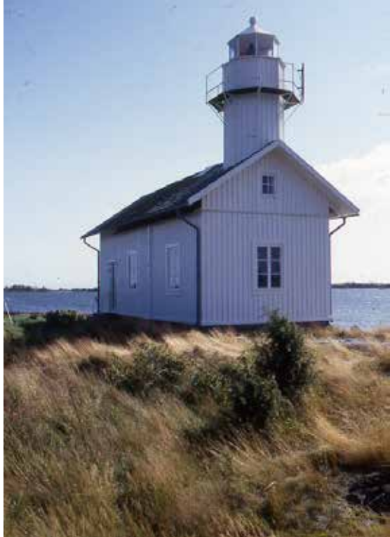
Gunnarsholmen fyr i Lurö skärgård.

Så skapades en vänerdynasti ute i skärgården. Det är en förening av släkter som kommit att påverka sjöfartens säkerhet och fyrningen under lång tid. En stark känsla för tradition och lojalitet med uppgiften gjorde att yrket gick i arv och ättlingar till de första fyrvaktarna och deras hustrur spreds runt om i Väner. Från Gälle udde i sydväst