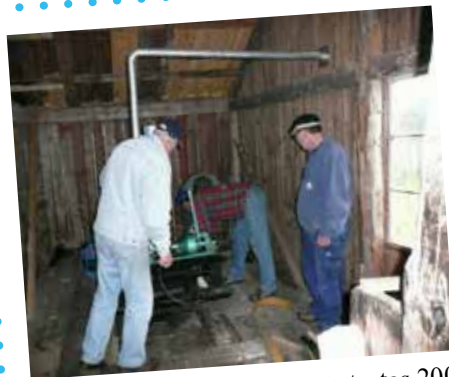
Tändkulemotorn i Pumphuset startas 2009

Se filmen på hemsidan under fliken Pumphuset