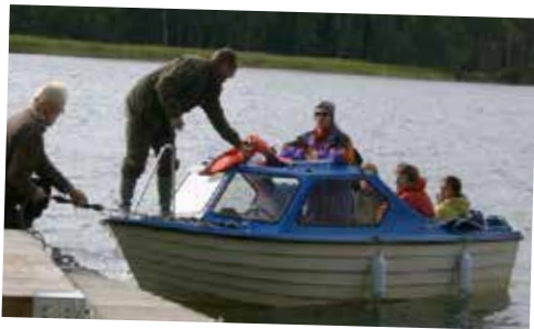
Blåbåren vid bryggan på Bärön hösten 2007

Se filmen på hemsidan under fliken Pumphuset