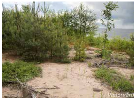
Igenväxt sandstrand på Arnön.

Som en stor ”natur” som Vänern representerar finns många sådana exempel. Naturen har skapat förutsättningarna under årtusenden vilket gjort att många speciella arter finns i och runt sjön.