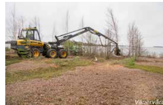
Återskapandet av öppen sandstrand med skördare.

inte längre översvämmas och påverkas av vattenmassan. Träd kan börja växa där det i tusentals år varit kargt och magert.