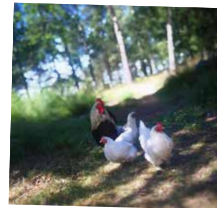
Hedemorahöns åter på Stenstaka