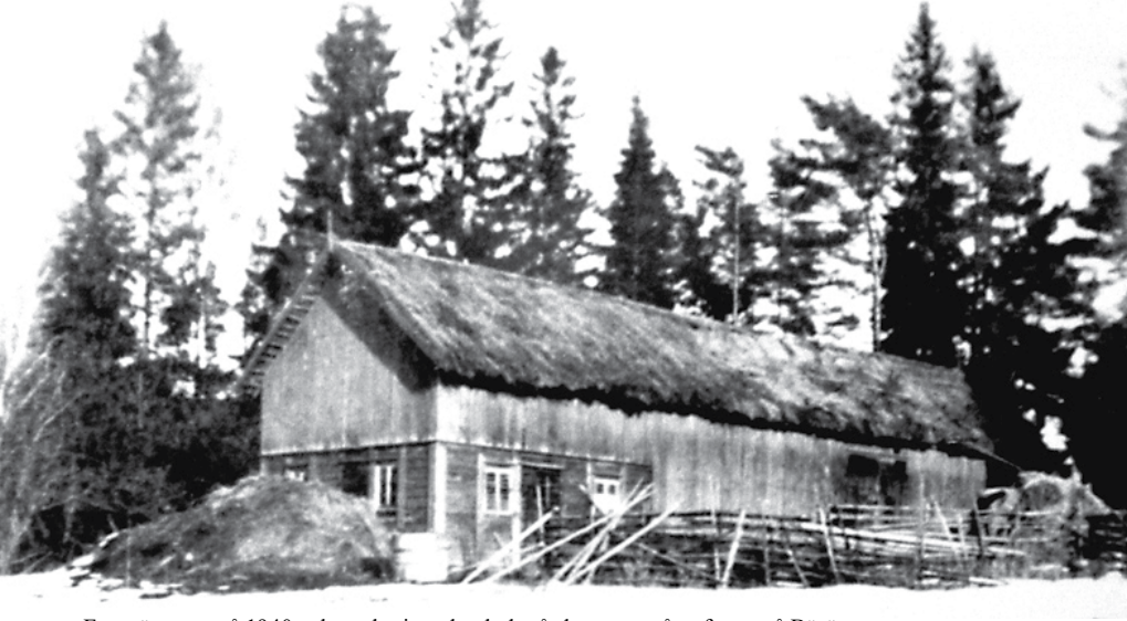
Fotot är taget på 1940-talet och visar den ladugård som en gång fanns på Bärön.