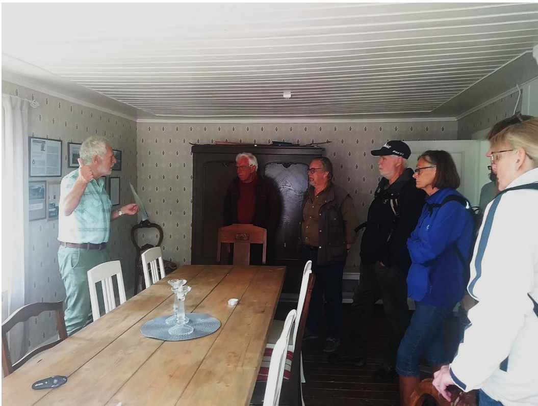
Information om Storön under Landsbygdsveckan.